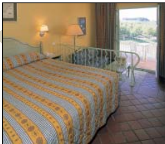
Jeu de formats pour ce sol intégrant une mosaïque de marbre.

Dans les chambres, les revêtements céramiques garantissent hygiène et facilité d'entretien.