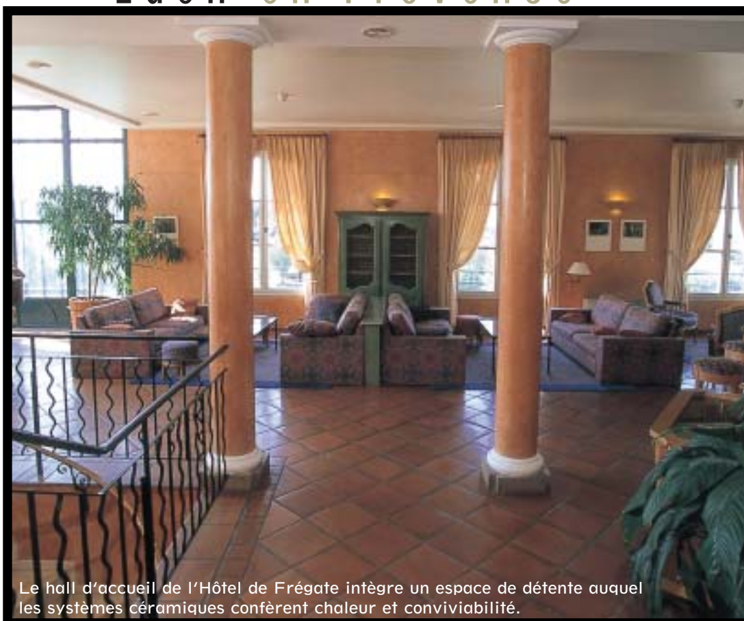
Le hall d'accueil de l'Hôtel de Frégate intègre un espace de détente auquel les systèmes céramiques confèrent chaleur et convivialité.