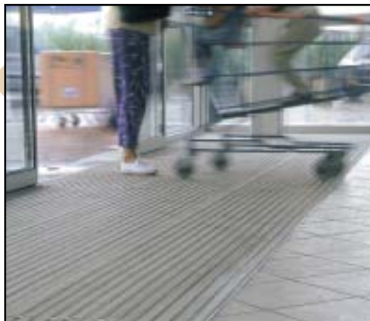
Les couleurs choisies participent à l'aspect naturel de la galerie

Les tapis d'entrée, disposés à chaque entrée, sèchent les semelles les jours de pluie.