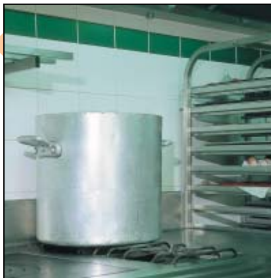
Les sols sont revêtus d'un carrelage à structure anti-dérapante.

En mural, le grès émaillé assure une résistance aux chocs efficace.