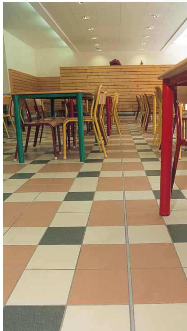
Embouts souples équipent chaises et tables pour limiter les bruits.

Pour les locaux spécifiques tels que les cuisines, les sanitaires, les vestiaires et les cas de rénovation, vous pouvez consulter les fiches « Systèmes Céramiques » correspondant à ces domaines.