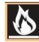
Résistance au feu