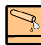
Résistance aux acides et bases

Que la mise en scène soit classique ou contemporaine, les systèmes céramiques s'adaptent à tous les styles.