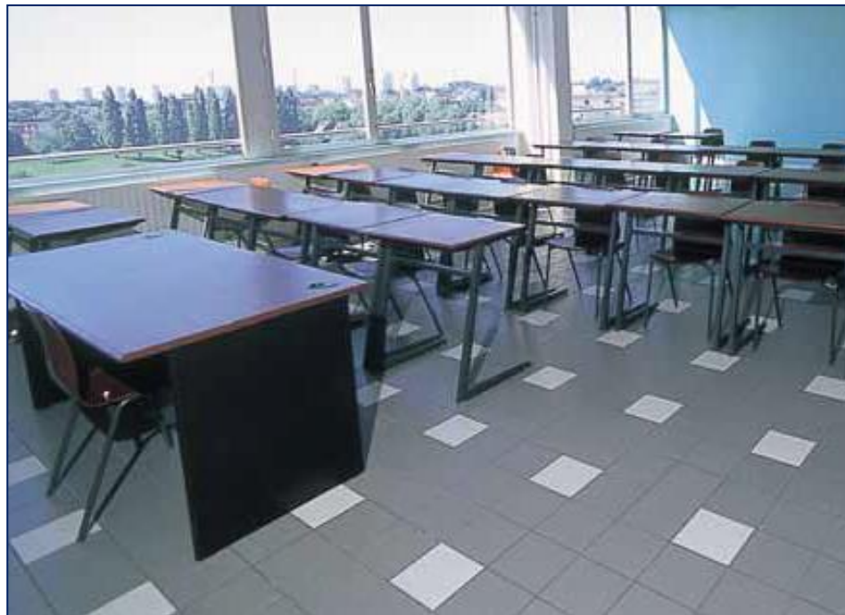
Les classes peuvent être revêtues de carrelage de couleurs variées signalant le type d'enseignement dispensé.

La norme la XP P 05-011 prévoit la pose d'un tapis d'entrée (barrière antisalissure) au accès donnant directement sur l'extérieur.